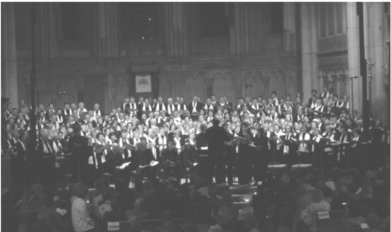
Le Grand Chœur (280 choristes) - Primatiale Saint Jean de Lyon - 22/10/2005

Festival des Jours de Lumière de Saint Saturnin en Auvergne (1ère en intégrale : septembre 2005)